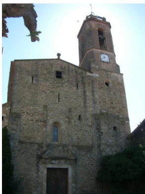
Parròquia de Colomers

va mantenir en la família durant algunes generacions. La família estava vinculada a la Confraria del Roser, i participava activament en la vida de la parròquia. Va estudiar a l'escola del poble, i als setze anys se'n anà a treballar a Girona.