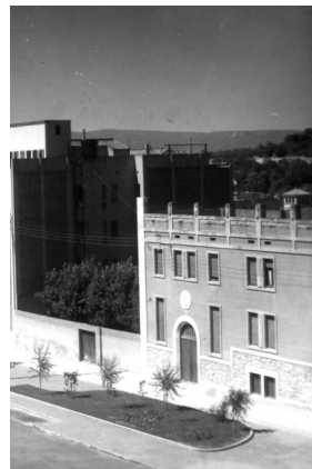
Convent de caputxins de Tarragona, anys 40

Els testimonis ens el descriuen com un frare alegre, franc i comunicatiu, amb esperit de servei i de pregària, que sabia guanyar-se les simpaties de tothom.