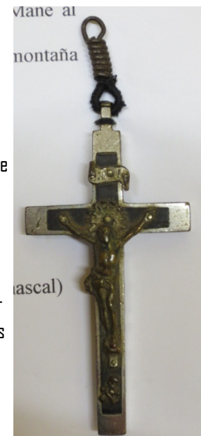
Creu de fra Carmel que es conserva a Tarragona

Amb els companys de màrtiri, durant el trajecte, se'ls va sentir cantar l'himne: "Amunt, germans, que és sols camí d'un dia! Jesús Rei nostre ens va al davant!"