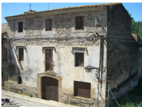
Ca l'Esclopeter, a Colomers, casa natal de fra Carmel